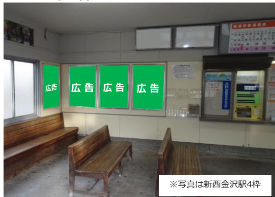
S・A・B駅の掲出イメージ