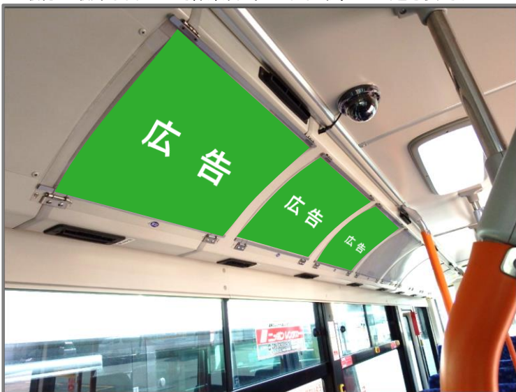
※写真は3枠分掲出のイメージです。