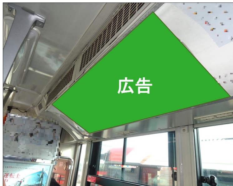
※写真は1枠分掲出のイメージです。